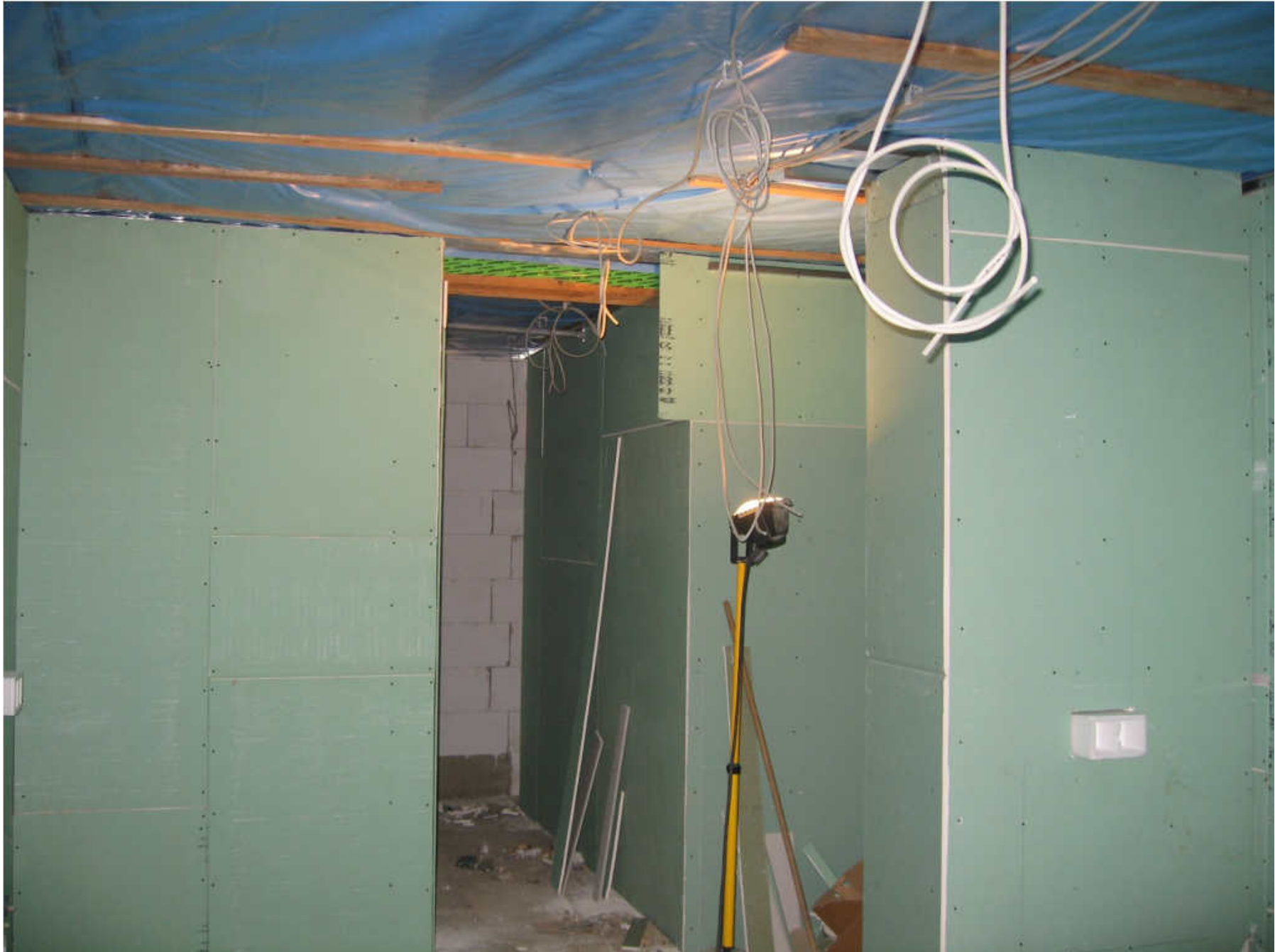
Hier fehlt noch die Decke und dann darf der Fliesenleger nächste Woche ran.