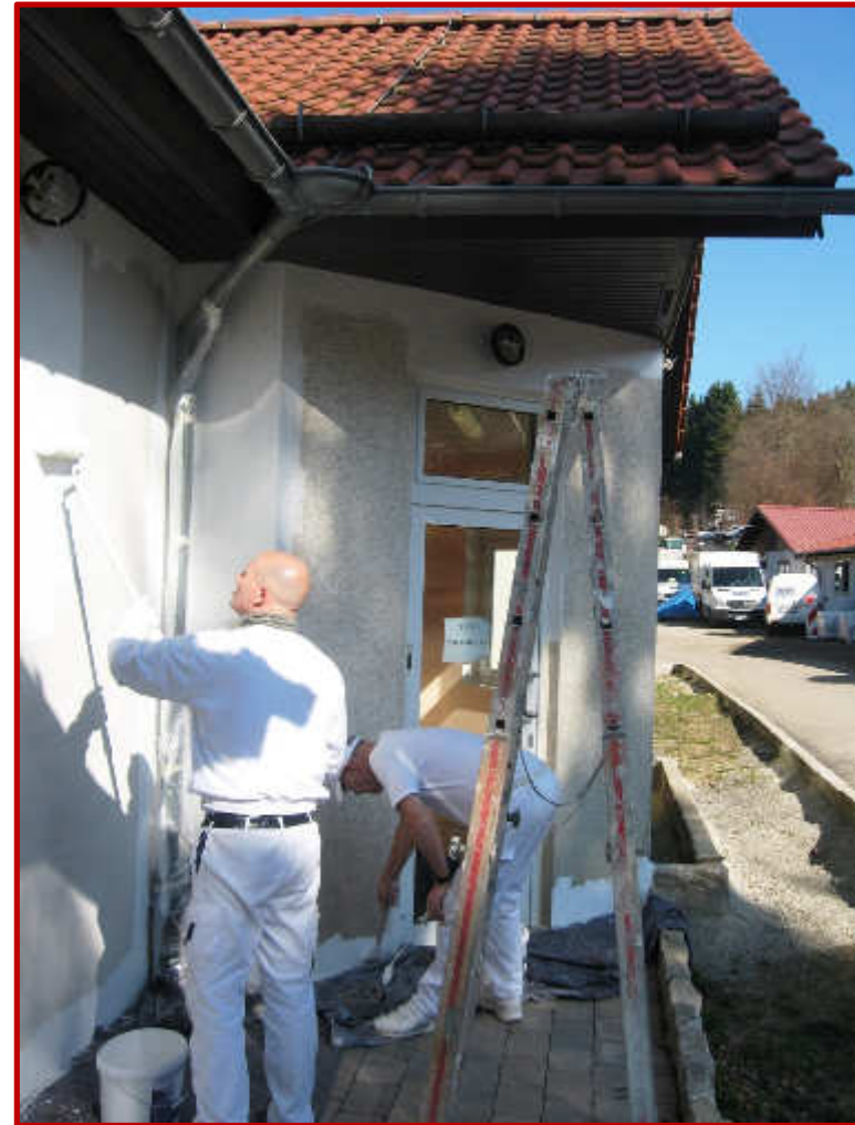
...und hier sind Montagsmaler am Werk!