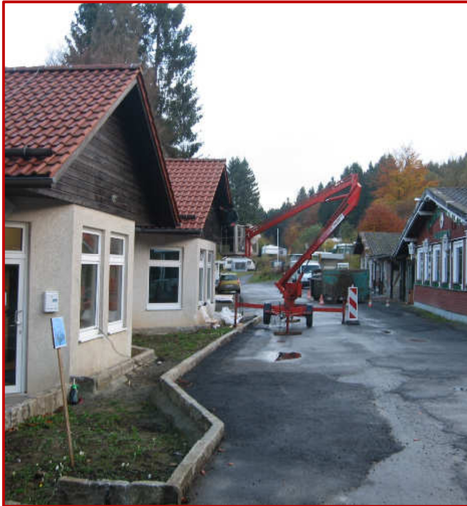
Dennis schwebt deshalb gleich über den Dingen und pinselt die Giebel am Haupthaus neu an.

Immer nur im Boden rumgraben ist doof. Heute machen wir mal was Schönes: