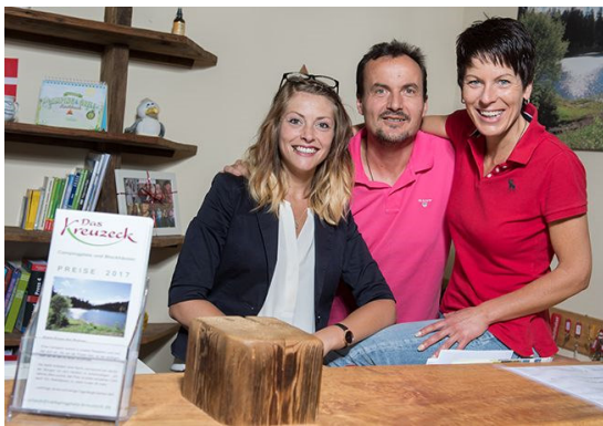
Den ganzen Tag Spaß und nachts mit Beleuchtung.