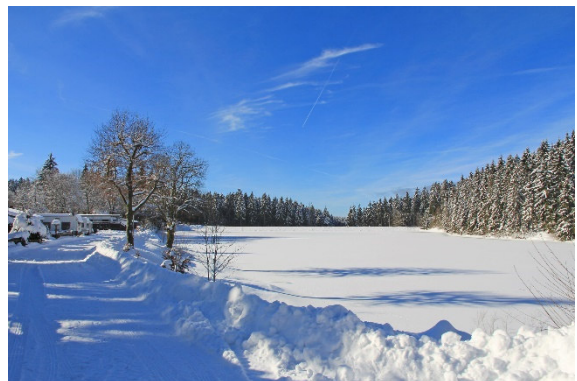
Postkartenpanorama, nur 300 m vom Büro.