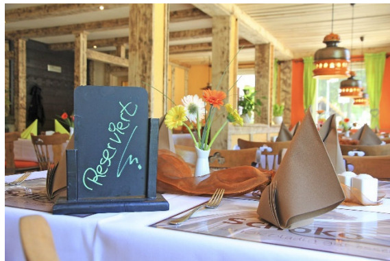
Ein einzigartiges Restaurant – „Das Schoko am Kreuzeck“