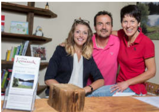
Den ganzen Tag Spaß und nachts mit Beleuchtung.