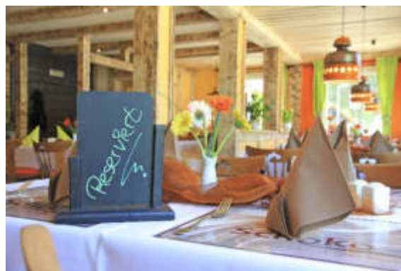
Ein einzigartiges Restaurant – „Das Schoko am Kreuzeck“