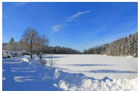
Postkartenpanorama, nur 300 m vom Büro.